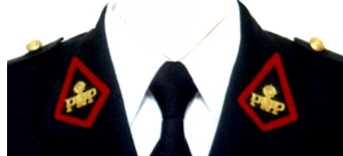
OFICIAL Y SUB OFICIAL DE SERVICIOS (MARRUECOS ROJOS)