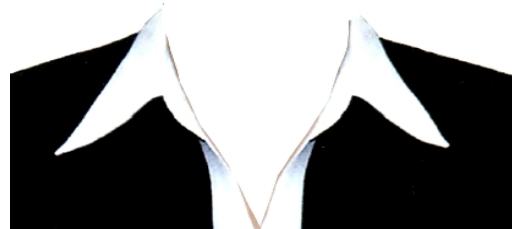
DAMAS (SACO Y BLUSA BLANCA)