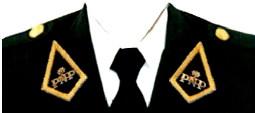
OFICIAL Y SUB OFICIAL DE ARMAS (MARRUECOS AMARILLOS)