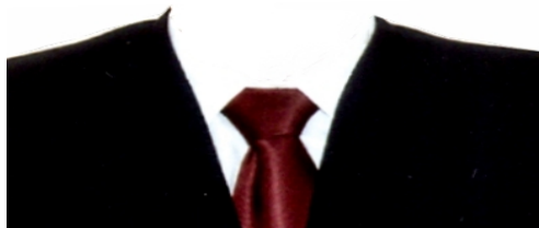
CABALLEROS (SACO Y CORBATA)